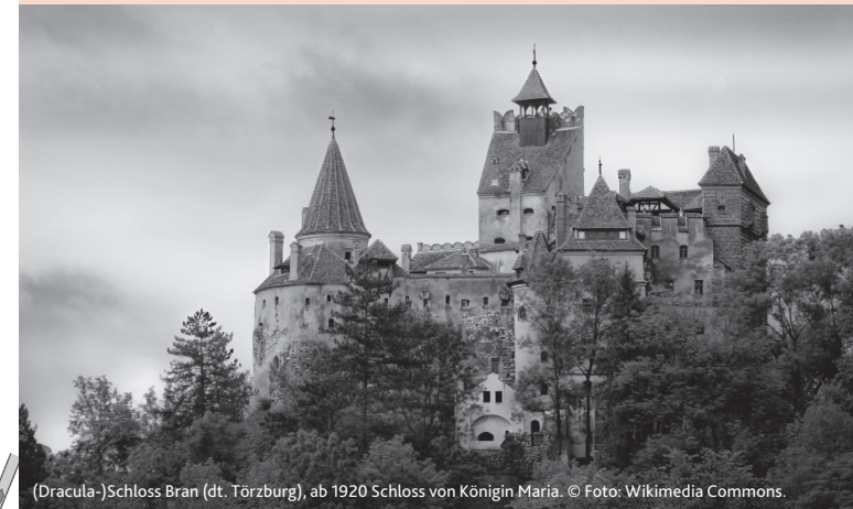
(Dracula-)Schloss Bran (dt. Törzburg), ab 1920 Schloss von Königin Maria.