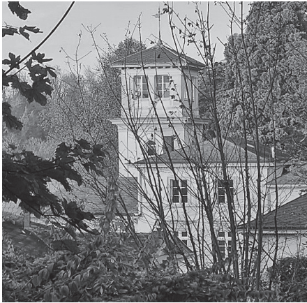
Schloss Heiligenberg.